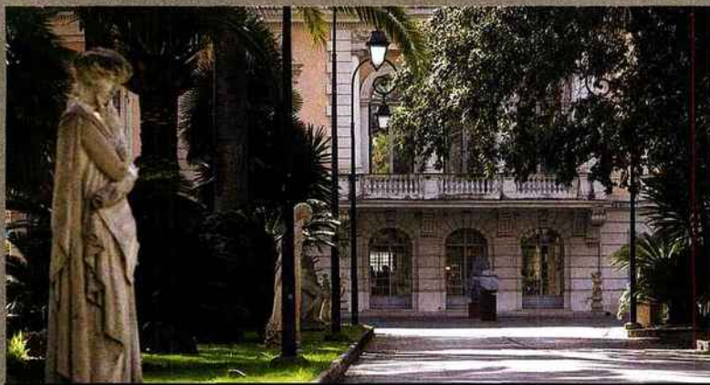
Des architectes de Louis XIV auraient, dit-on, participé à l'élaboration du palais-musée des Beaux-Arts.