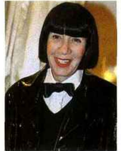
5/ Chantal Thomass.