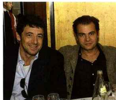
10/ Patrick Bruel et Clovis Cornillac.