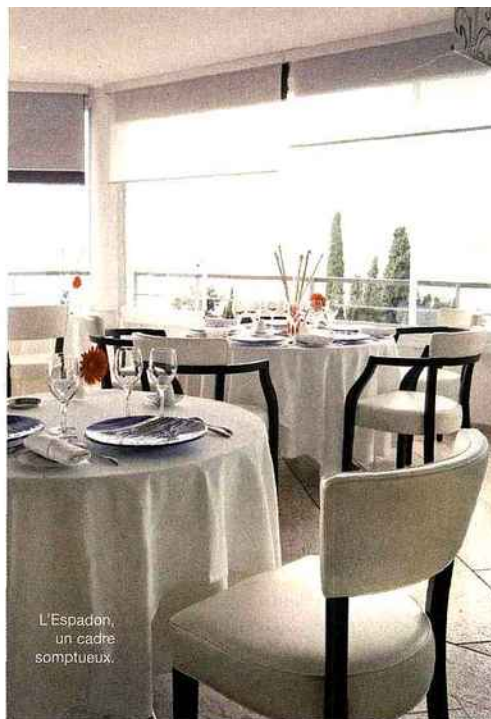
L'Espadon, un cadre somptueux.

Le Mirazur est un véritable lieu d'exception avec une vue à 300° à la fois sur la mer et sur la montagne. «La cuisine y est végétale, parfumée, pleine de cou-