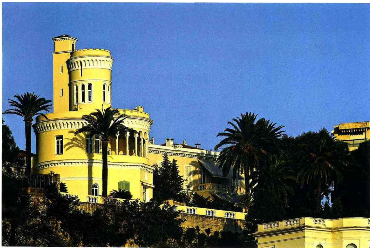
Baie des Anges et palais fastueux, un art de vivre la Côte d'Azur