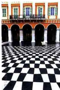
La « Tête carrée » de Sosno entrees de plage rococos ou design, une ville mille feuilles