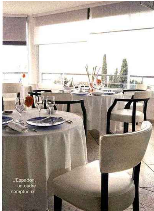
L'Espadon, un cadre somptueux.

Le Mirazur est un véritable lieu d'exception avec une vue à 300° à la fois sur la mer et sur la montagne. «La cuisine y est végétale, parfumée, pleine de cou-