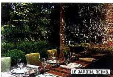
LE JARDIN, REIMS.

tél. : 03 26 24 90 90. Env. 50 € (carte). Menu : 28 €.