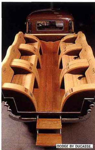
DODGE BY DUCASSE.

Chemin de Quinson, 04360 Moustiers-Sainte-Marie, tél. : 04 92 70 47 47.