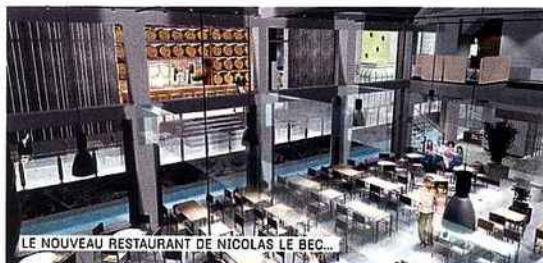
LE NOUVEAU RESTAURANT DE NICOLAS LE BEC...

37, quai Rambaud, Lyon II e , tél. : 04 78 42 15 00. Ouverture le 4 septembre.