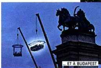
... ET À BUDAPEST