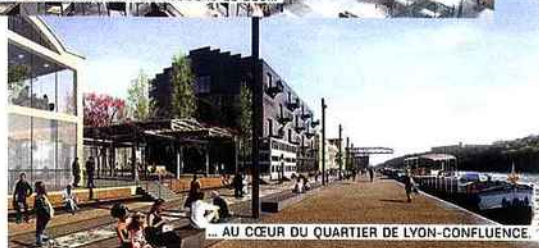
... AU CŒUR DU QUARTIER DE LYON-CONFLUENCE.