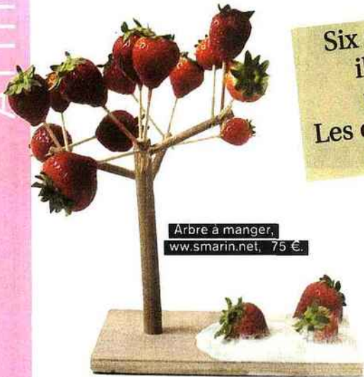
Arbre à manger, www.smarin.net, 75 €.

Six semaines avant le jour J, il n'est pas vain de faire un repérage shopping. Les objets nés de l'imagination des artistes ont la cote.