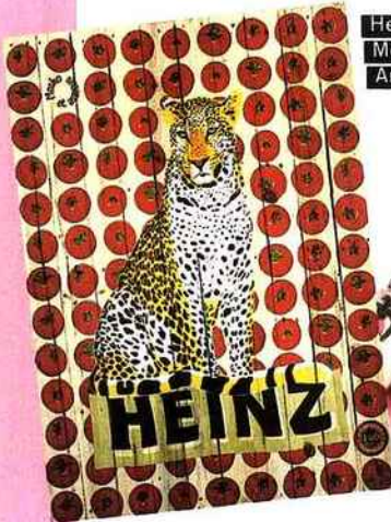
Heinz vu par Mosko & associés, Artcurial.