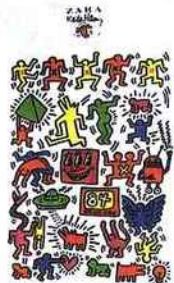
Tee-shirt Keith Haring, Zara, de 16,95 € à 29,95 €.