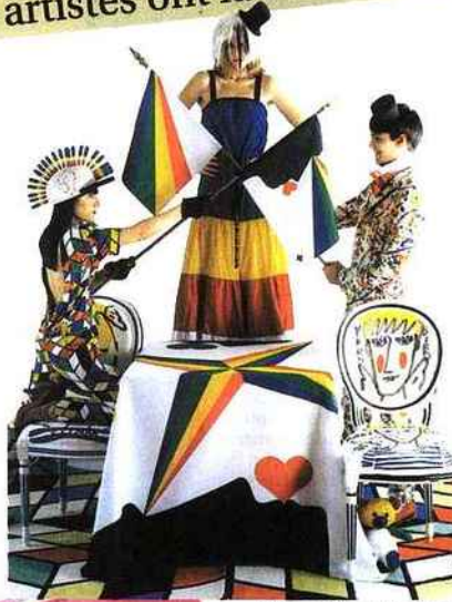
Ligne Castelbajac, Garnier-Thiebaut.