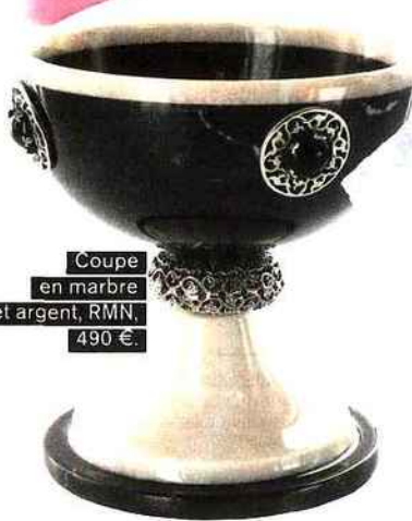
Coupe en marbre et argent, RMN, 490 €.