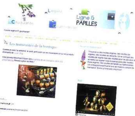
Les blogs culinaires ont également relayé l'opération de communication. Ici, Ligne & Papilles, numéro 1 des blogs culinaires.

Le web est également un moyen intéressant de diffuser l'image de marque des Champagnes de Vignerons à moindre coût. Une grande campagne de communication sur Internet a ainsi été lancée fin octobre. 1 300 blogs ont été invités à diffuser sur leur page d'accueil le film de la nouvelle campagne de publicité qui présente la naissance de la figurine faite de muselet et de capsule dorée. L'intérêt? S'appuyer sur des blogs visités par la cible de conquête de la marque collective pour attirer les internautes sur le site