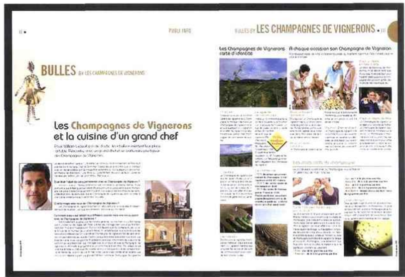
Les Champagnes de Vignerons, présents dans la presse magazine, comme ici dans «A Nous».

Difficile de ne pas voir la campagne de publicité des Champagnes de Vignerons en cette période de fin d'année. 25 parutions dans la presse sont en effet prévues d'ici à décembre, soit les trois-quarts des investissements publicitaires 2009 de la marque collective. « La commission communication a fait le choix de communiquer principalement d'octobre à décembre afin d'accompagner au